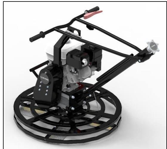
Detailfoto opgeklapt stuur